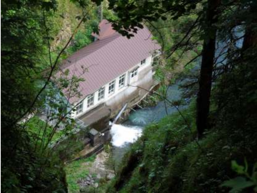
Kraftwerk beim Vilsfall