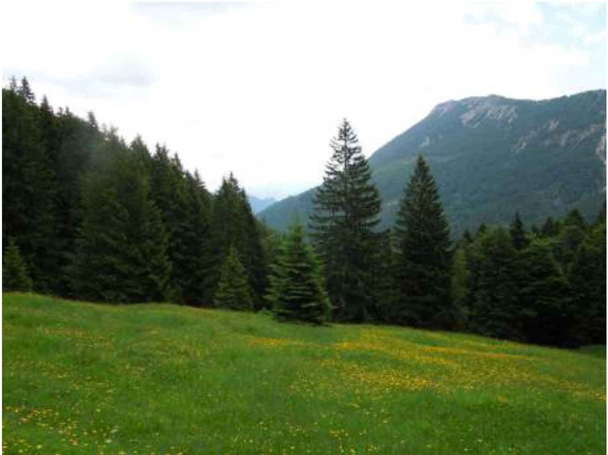
Erste Etappe im Himmelreich