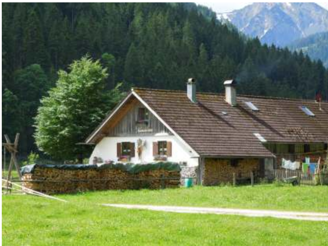
Bei der Kälberhofalpe