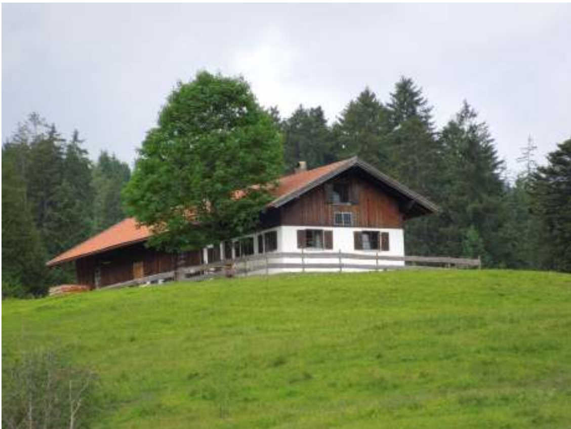
Bei der Scheidbachalpe