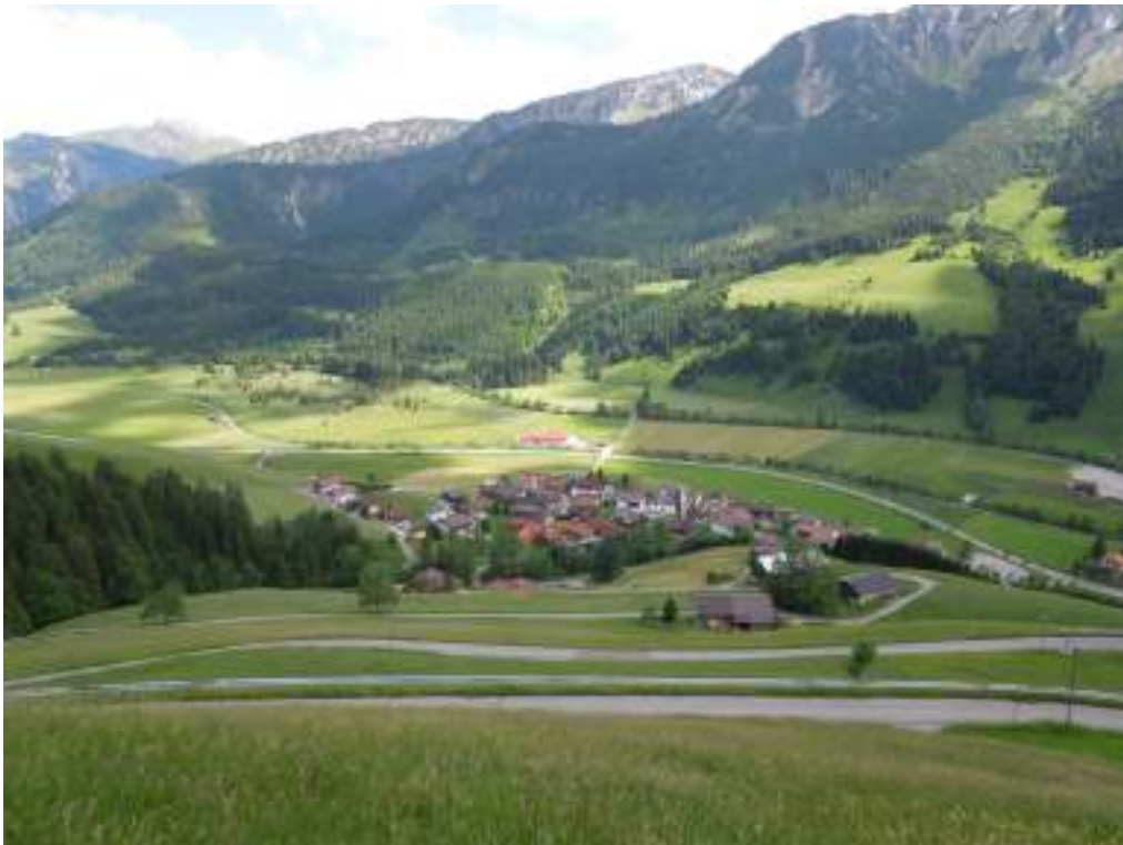
Blick vom Zugpitzblick nach Zöblen