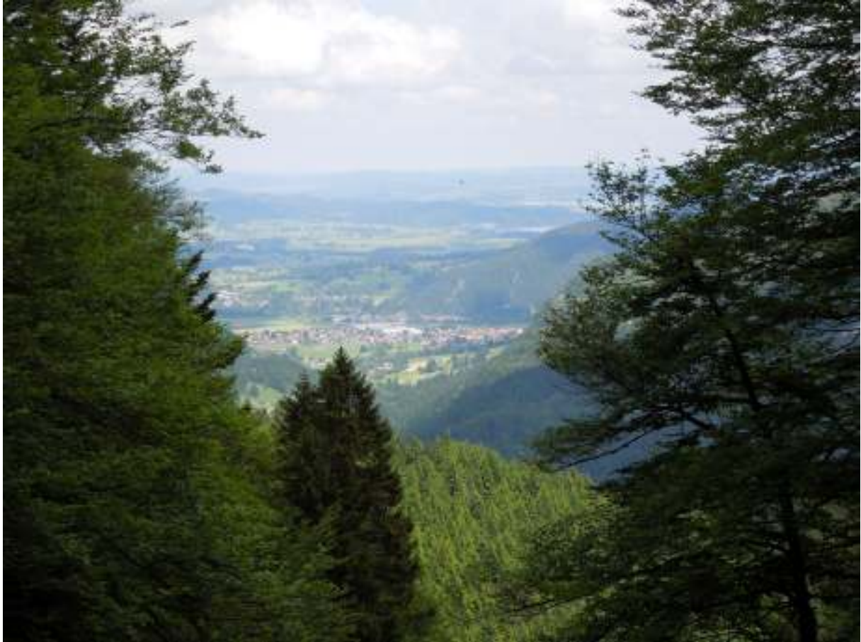
Blick nach Pfronten